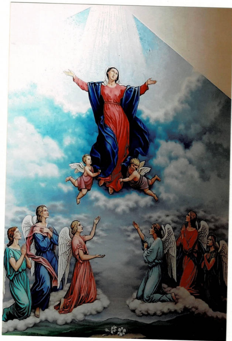
Malowidło: Wniebowzięcie Najświętszej Maryi Panny