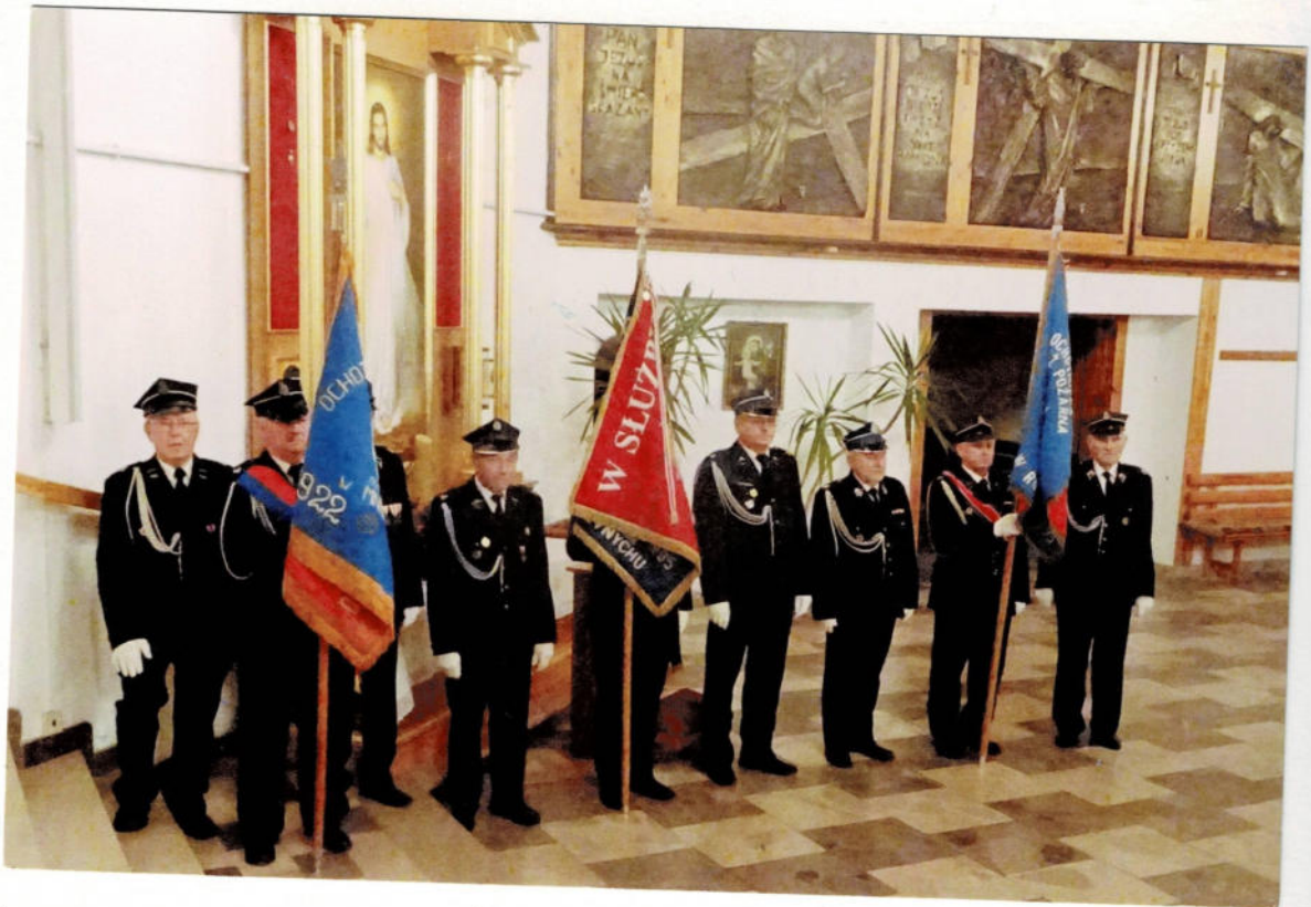
Na zdjęciu - strażacy z naszej jednostki OSP w Ariszku